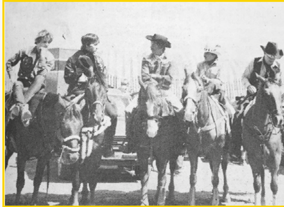
Des cowboys endimanchés pour la circonstance... Le Rodéo de Guigues a donné lieu à un spectacle amusant, de qualité, et somme toute, fort apprécié des spectateurs présents.

Au fil des années, le Festival Western acquiert beaucoup de notoriété, allant jusqu'à étendre ses activités sur quatre jours et attirer plus de 6 000 visiteurs. Il peut se vanter d'être un incontournable du monde hippique au Québec, faisant partie du circuit professionnel.