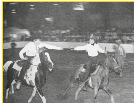
La course à relais, une épreuve enlevante du Rodéo de Guigues.