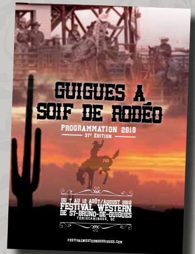
Page couverture du dépliant