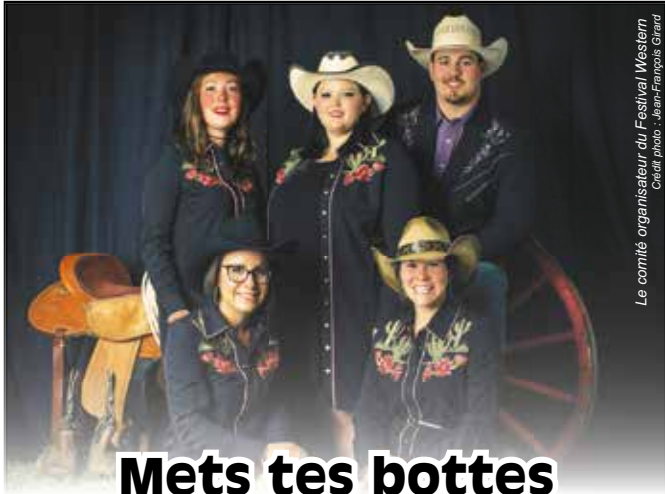
Le comité organisateur du Festival Western