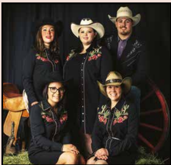
Comité du Festival Western

en ligne, le Festival «Western a misé sa programmation sur un aspect familial et chaleureux avec notamment un conte folklorique à saveur western, « Le cor à conte », présenté au Domaine Breen.